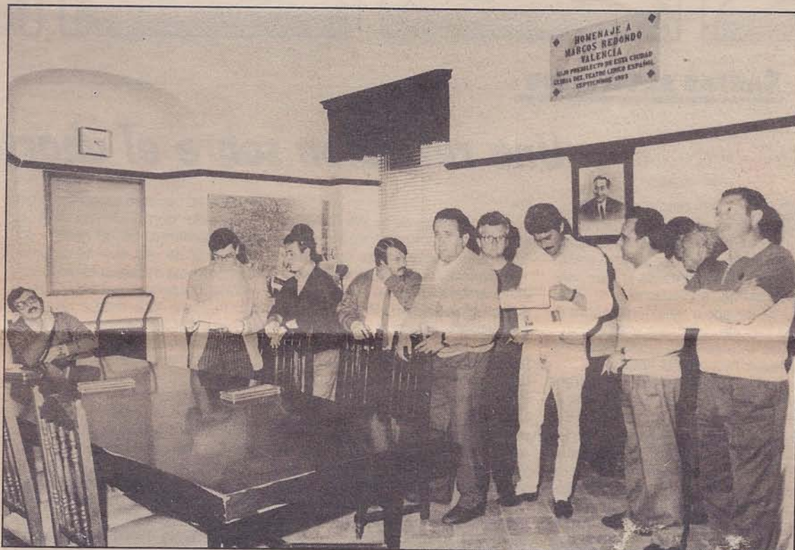
Algunos de los alcaldes encerrados en el Ayuntamiento de Pozoblanco.