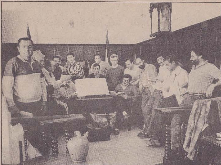
DE LA FUENTE/D-16

Los alcaldes encerrados han recibido la solidaridad de casi todos los partidos.