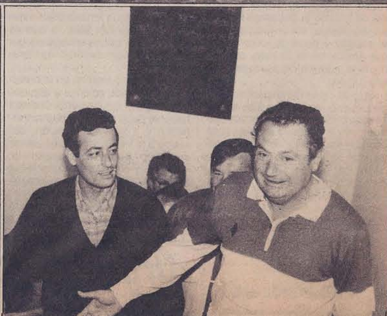
Los alcaldes encerrados en el Ayuntamiento de Pozoblanco en diversos momentos durante el día de ayer.