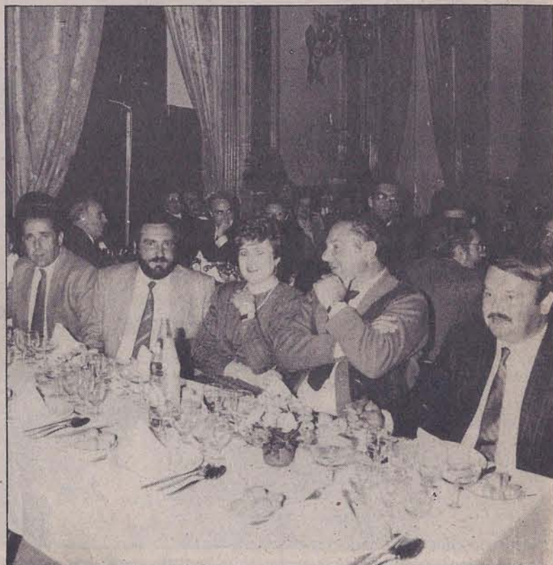
Toda la comarca de los Pedroches estuvo representada en la ceremonia, a través de sus alcaldes.