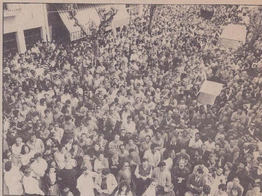
DE LA FUENTE/D-16

Los alcaldes encerrados han recibido la solidaridad de casi todos los partidos.