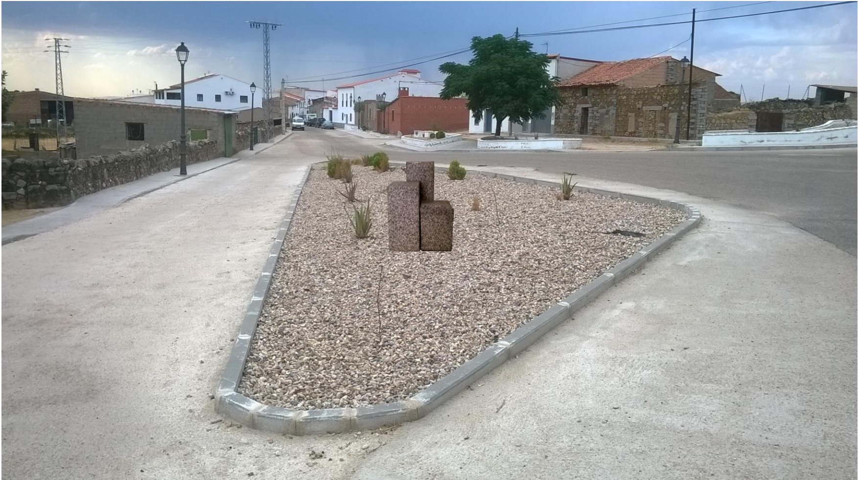
Ubicación 3: frente al pozo de La Añoruela-