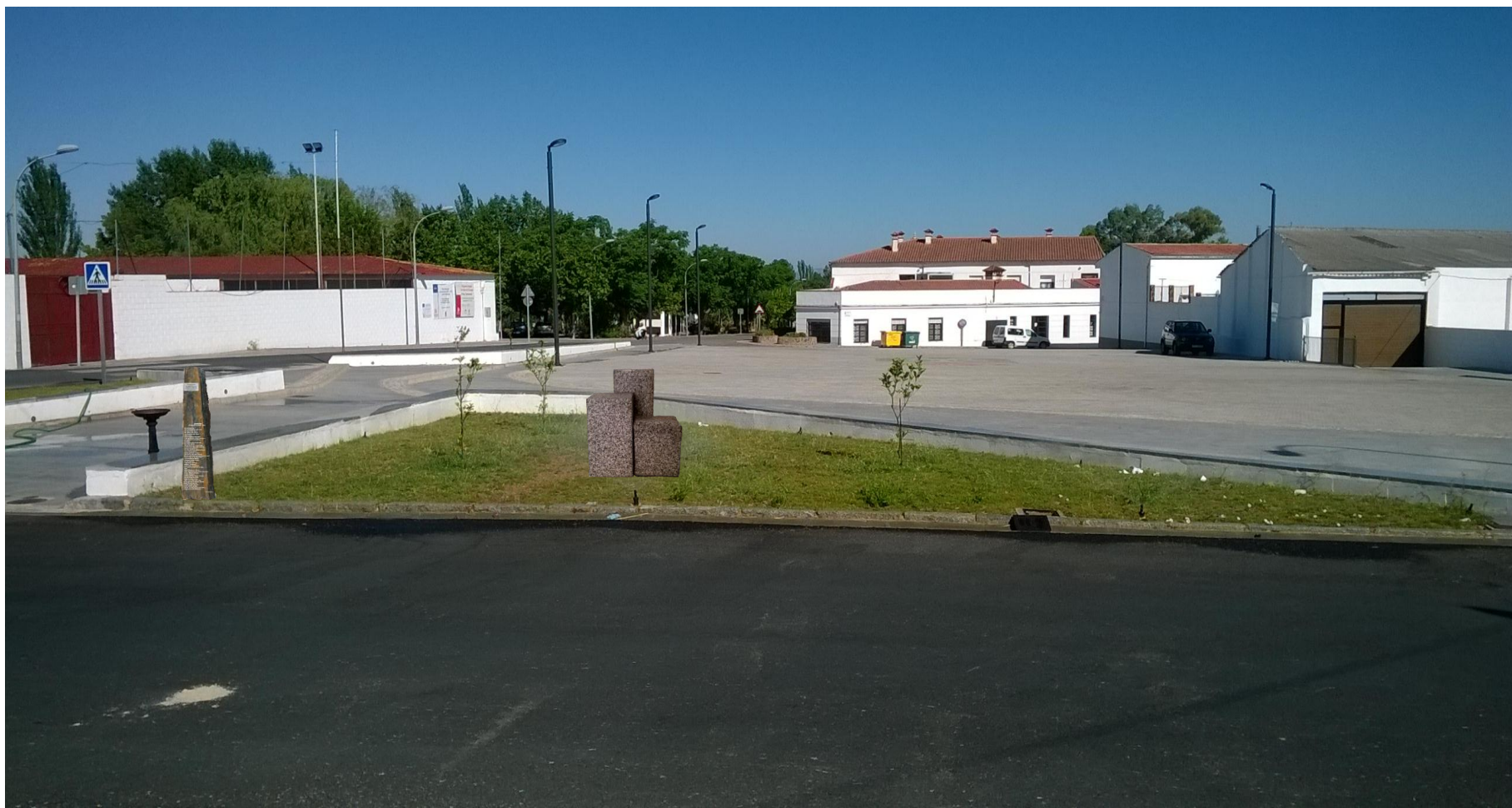
Ubicación1 de la fuente: triángulo de césped en la explanada frente a la Caseta Municipal.