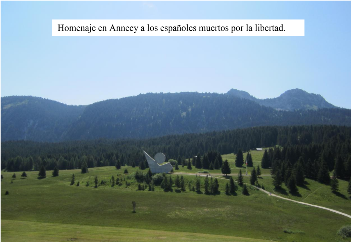
Vista parcial del plató de Glières con el Monumento Nacional a la Resistencia.

Homenaje en Annecy a los españoles muertos por la libertad.