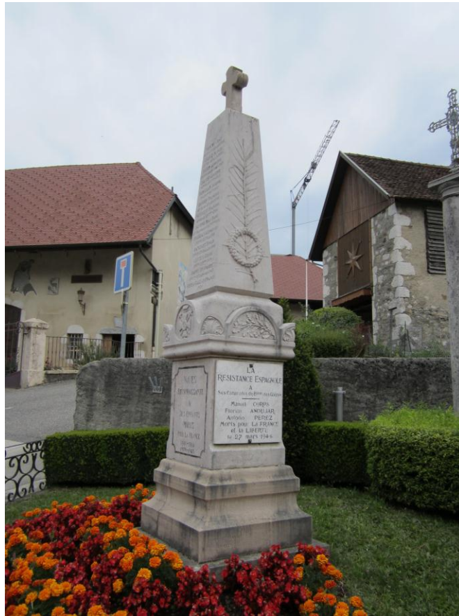
Monumento a los españoles del Batallón de Glières en Nâves-Parmelan.