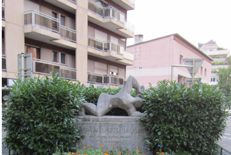
Memorial en Le Clus (Nâves-Parmelan).