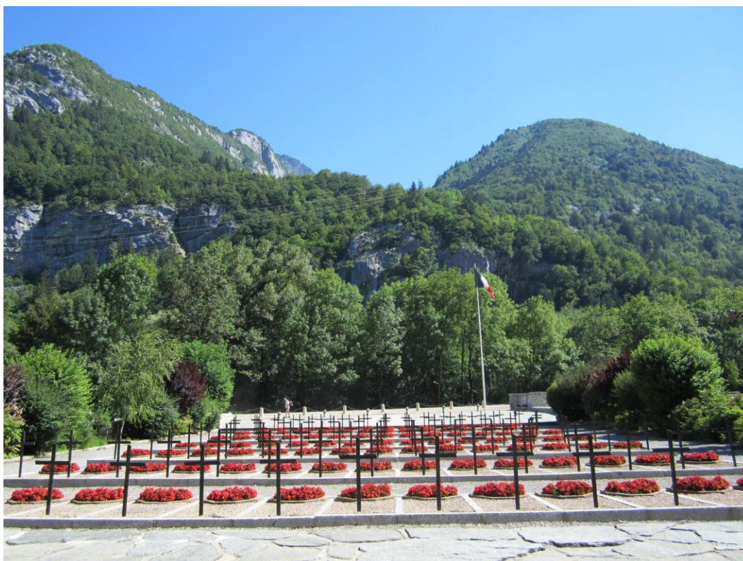
Vista parcial de la Necrópolis Nacional de Morette.