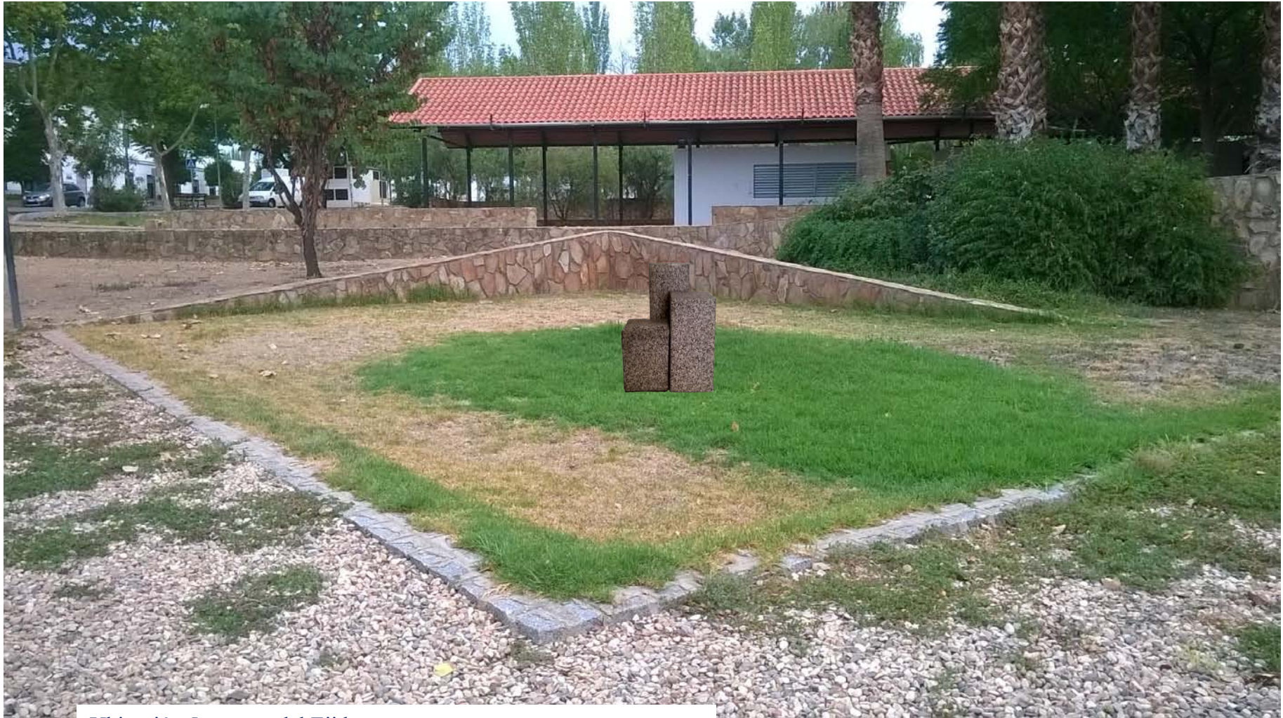
Ubicación 5: parque del Ejido.